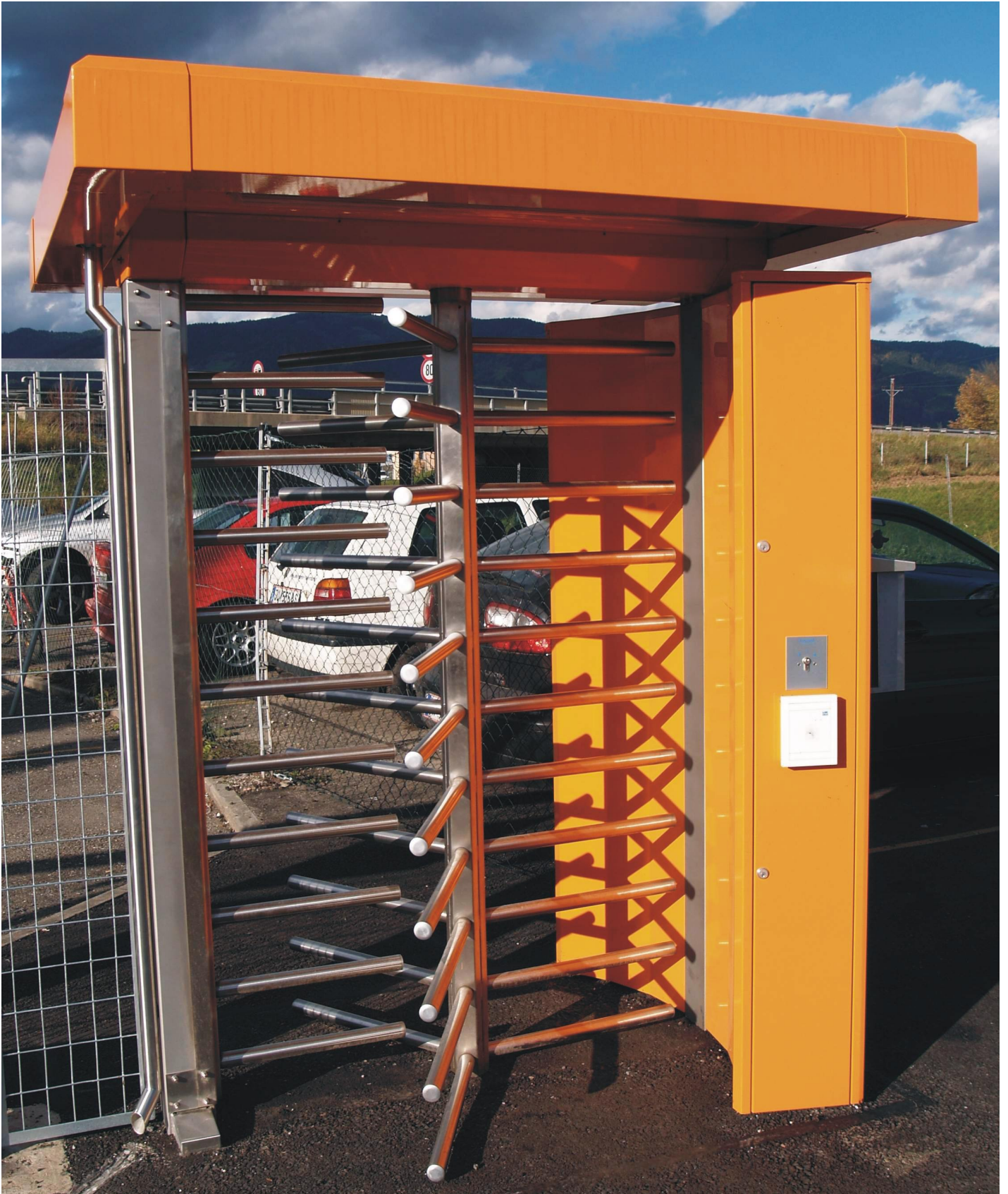
Abbildung: ECCO 120 HB in Sonderfarbton mit Dach Comfort und Regenablaufrohr