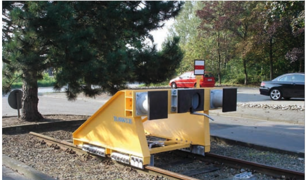
Typ 10 EB M+S, Einbauort: z.B. ProRail, Niederlande